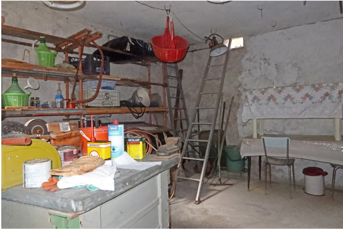
PIANO PRIMO SOTTOSTRADA