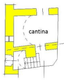
PIANO PRIMO SOTTOSTRADA