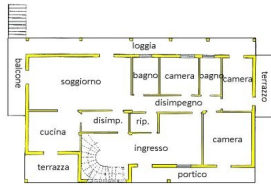
PIANO TERRA H. 250