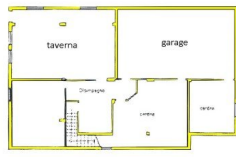
PIANO SEMINTERRATO H. 220